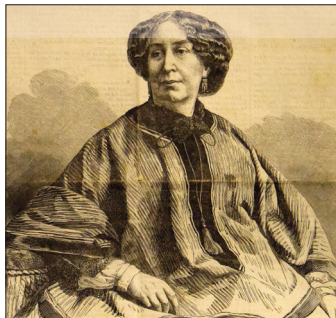
George Sand à la Une du Nouvel Illustré en 1866

L'exposition consacrée à la Bonne Dame de Nohant n'est pas très vaste, elle est toutefois riche et originale par son contenu. On connaît George Sand écrivaine, on connaît un peu moins George Sand, journaliste. L'exposition, qui permet de faire jaillir du passé près d'une trentaine de revues et journaux originaux, est à double champ : on y découvre des périodiques dans lesquels on peut lire des écrits de George Sand, mais également des revues d'époque qui parlent de l'écrivaine et de son œuvre.