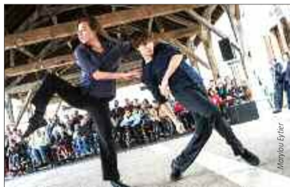
Sur un air deux