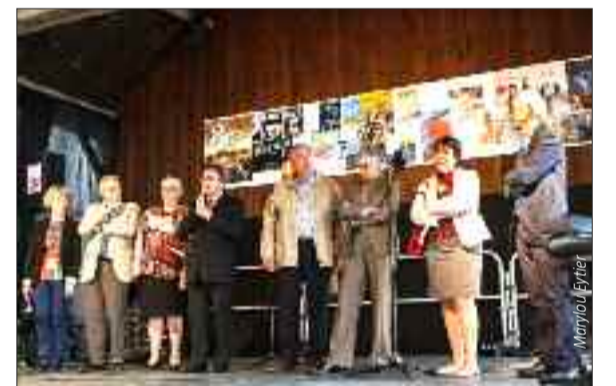
Les discours de la 23 e édition