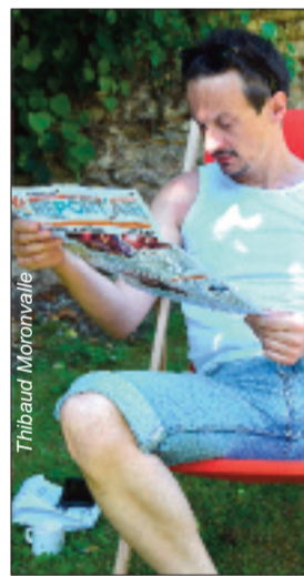
Lecture et farniente.