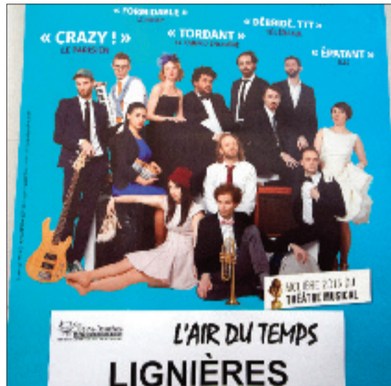
Ah l'affiche !

Nous le lui promettons à vous, vous allez rire de ce spectacle déplacé et comique. De plus, nous ne risquons pas de nous ennuyer, le spectacle est participant : peut être ce qui est plus, on gagnera au questionnaire des traductions moisies faites de chansons. Qui n'a pas jamais essayé de traduire les mots d'une chanson anglaise et s'est rendu compte que le