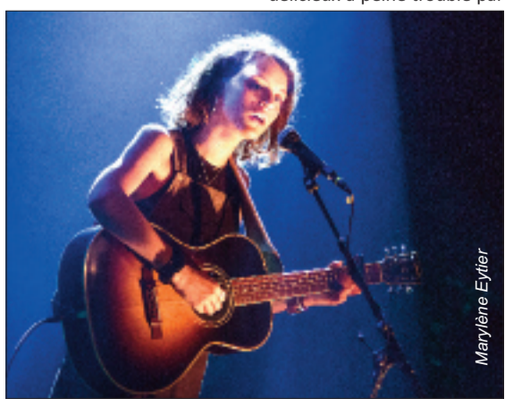
Pomme d'amour au Manège