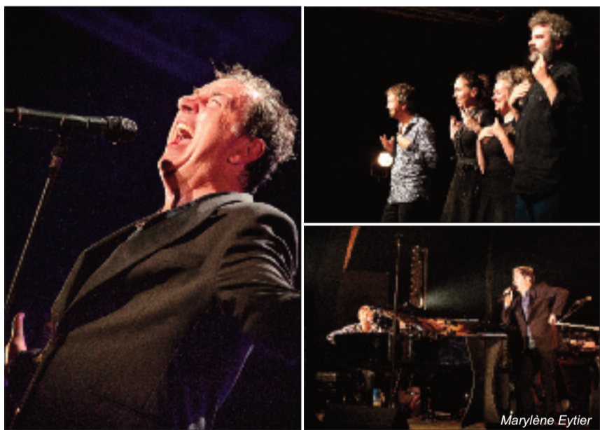
« Je serai le roi du music-hall »

Jean-Paul Fictif témoigne sur La vie (titre provisoire), le spectacle de François Morel. Toute ressemblance avec des personnes existantes serait purement fortuite.