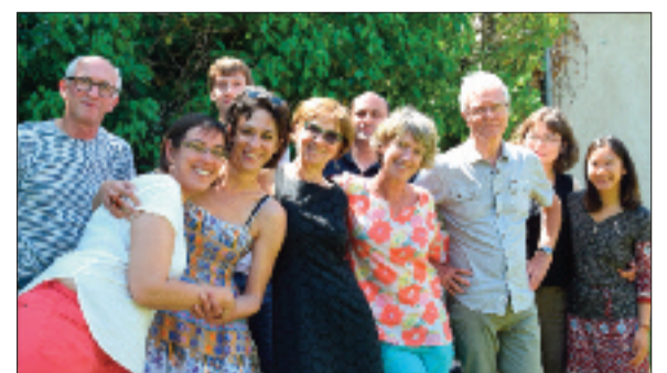
La belle équipe des permanents des Bains-Douches.