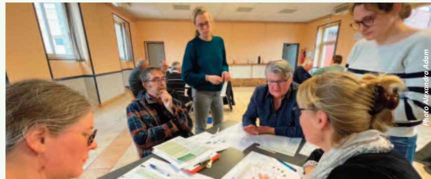
Pendant la séance de travail.

L'antenne saint-amandoise du CPIE Brenne-Berry sensibilise, au travers d'ateliers participatifs, à la construction d'un raisonnement scientifique indémontable.